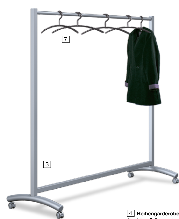
3 Kleiderständer event

Extra breiter Kleiderständer. Sehr stabile Ausführung aus Stahlrohr, pulverbeschichtet in Alusilber. Bügelrohr Ø 30 mm. Mobil durch 4 Doppelenkrollen mit Radfeststellern.