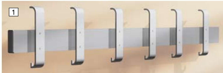
1 Einzel-Wandgarderobe Arosa