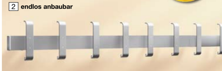
2 endlos anbaubar